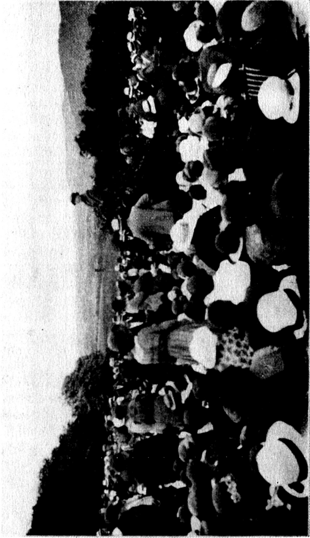
Mathilda Wrede spricht vor einer Versammlung.