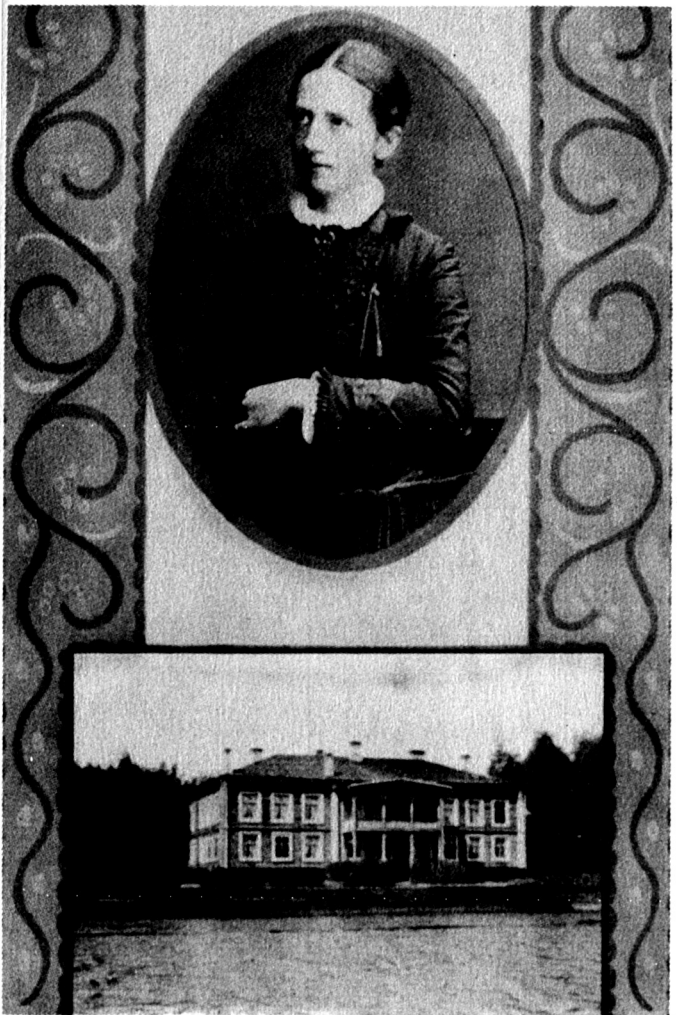
Rabbelugn, das Elternhaus von Mathilda Wrede.