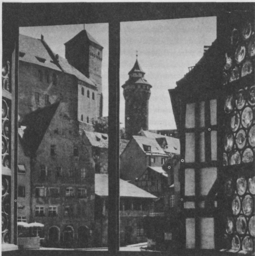
Blick aus einem Fenster des Albrecht-Dürer-Hauses auf Nürnbergs Burg

lichen Gruß« von Veit Stoß in der gleichen Kirche, oder an Peter Vischers Sebaldusgrab in St. Sebald. Vieles andere wäre noch zu nennen. Nürnberg ist einfach eine schöne, geschichtsträchtige Stadt.