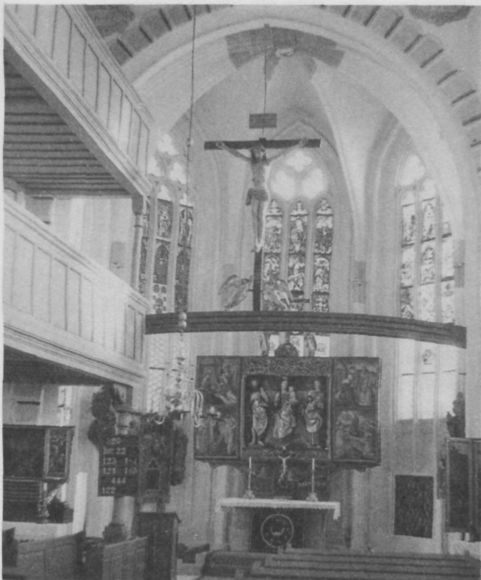
Chor und Hauptaltar (Stilkreis Veit Stoß) der St. Johanniskirche

In dieser Zeit war auch die St. Johanniskirche gründlich zu renovieren angesichts des Albrecht-Dürer-Jahres 1971. Der 500. Geburtstag des berühmten Malers sollte groß gefeiert werden. Die Johanniskirche sollte so renoviert werden, daß ihre Innenausstattung mit vielen großartigen Kunstwerken wieder das Aussehen erhielt, das sie im 15. Jahrhundert hatte. Viele Sitzungen fanden mit dem Architekten, den Kirchenbauämtern und dem Landesamt für Denkmalspflege in München statt. Alte Stiche waren zu begutachten, um die Renovierung auch getreu dem historischen Vorbild durchzuführen.