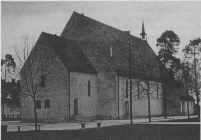
Die Lutherkirche auf dem Hasenbuck

Nun ging es also nach Nürnberg-Lichtenhof, in den Südosten der Stadt. Ich bekam die Aufgabe, den Sprengel Lutherkirche zu übernehmen, den ich dann schließlich auch zur selbständigen Gemeinde ausbaute und führte. Die Lutherkirche auf dem Hasenbuck, der höchsten Erhebung in Nürnberg, hat eine wundervolle Lage. Sie liegt allein auf ihrem Hügel und ist umgeben von einem lichten Föhrenwäldchen, Wiesen und Spazierwegen. Am Fuße des Hügels liegt eine Siedlung, die vornehmlich für Kriegsbeschädigte und Kriegshinterbliebene gebaut war. Gegen Westen dehnt sich das weite Gelände der Maschinenfabrik Augsburg-Nürnberg (MAN) aus, südöstlich ist das große Rangierbahnhofgelände. Etwa 4000 Menschen gehörten damals zum Sprengel Hasenbuck.