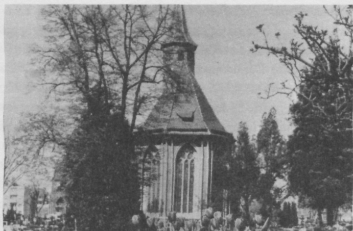
St. Johanniskirche (1377) auf dem St. Johannisfriedhof