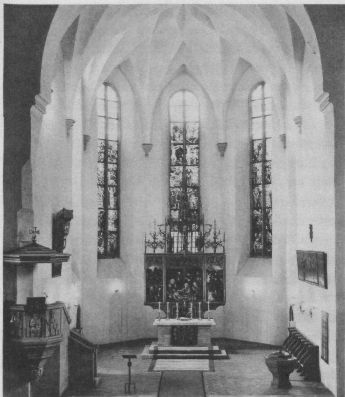
Chor der Friedenskirche mit dem Hauptaltar aus dem ehemaligen Augustinerkloster

zwischen Tod und Teufel«, und dann versucht, Dürer vor allem auch als Christenmenschen vor der großen Zuhörerschar lebendig werden zu lassen.