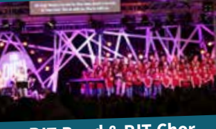
PJT-Band & PJT-Chor

iThemba kommt aus der Zulusprache und bedeutet „Hoffnung“. Und genau die wollen die südafrikanischen Teams, die hinter dem Namen stecken, durch Musik, Tanz, Theater und ihre persönlichen Lebensgeschichten in der Welt verbreiten - und natürlich auch hier bei uns!