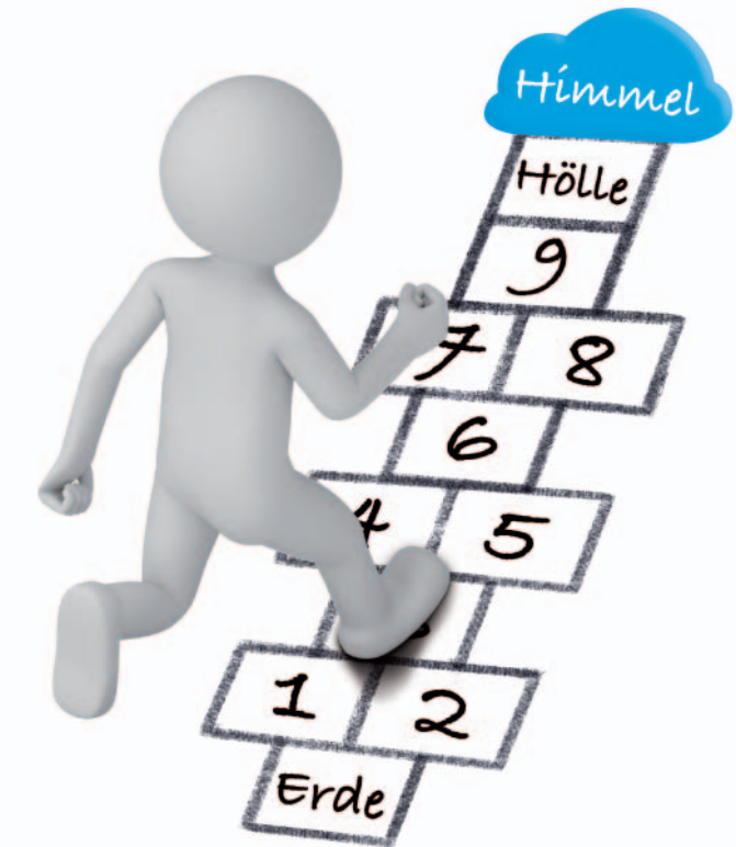
Titelbild © fotomek / Fotolia.com