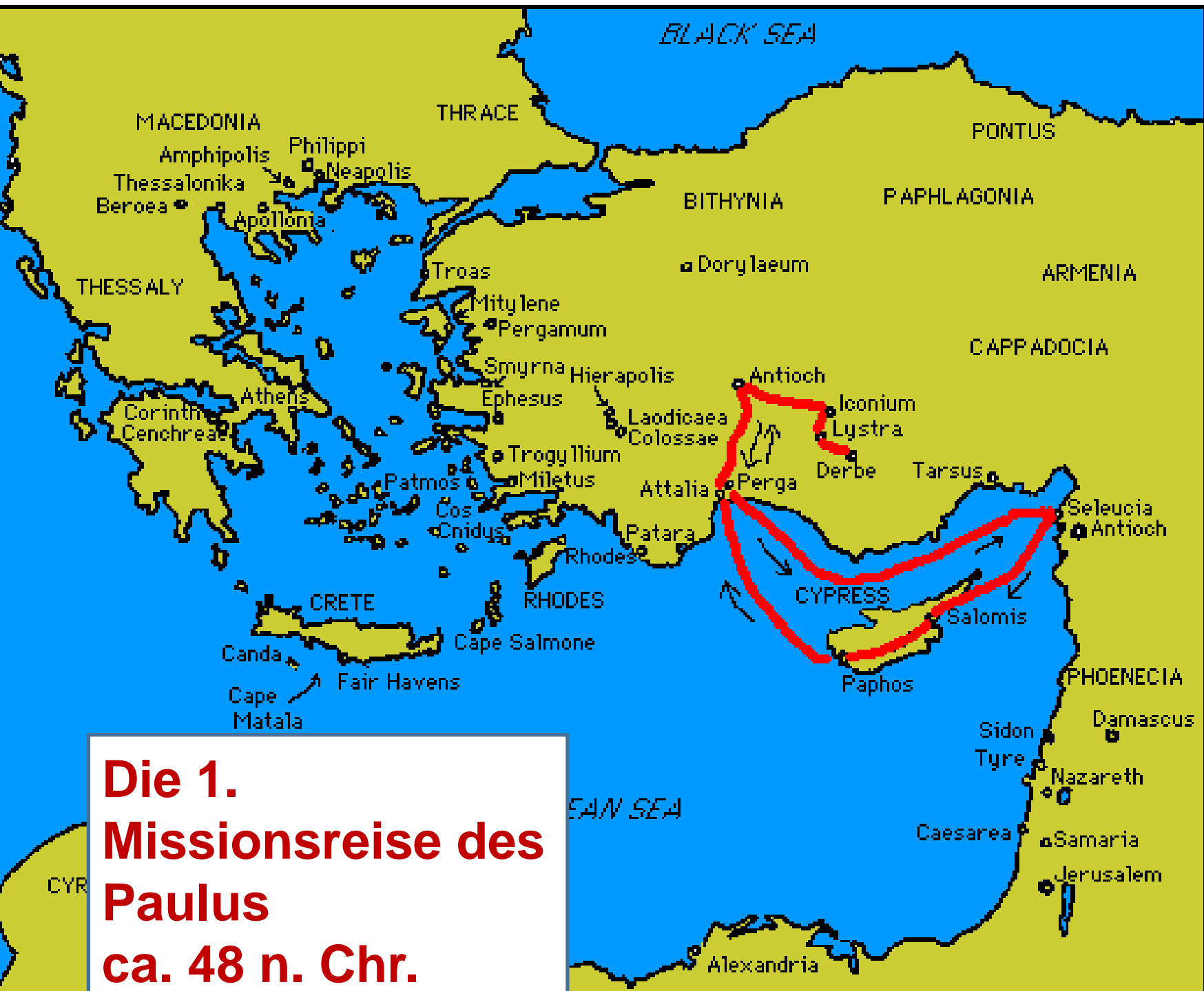
Die 1. Missionsreise des Paulus ca. 48 n. Chr.