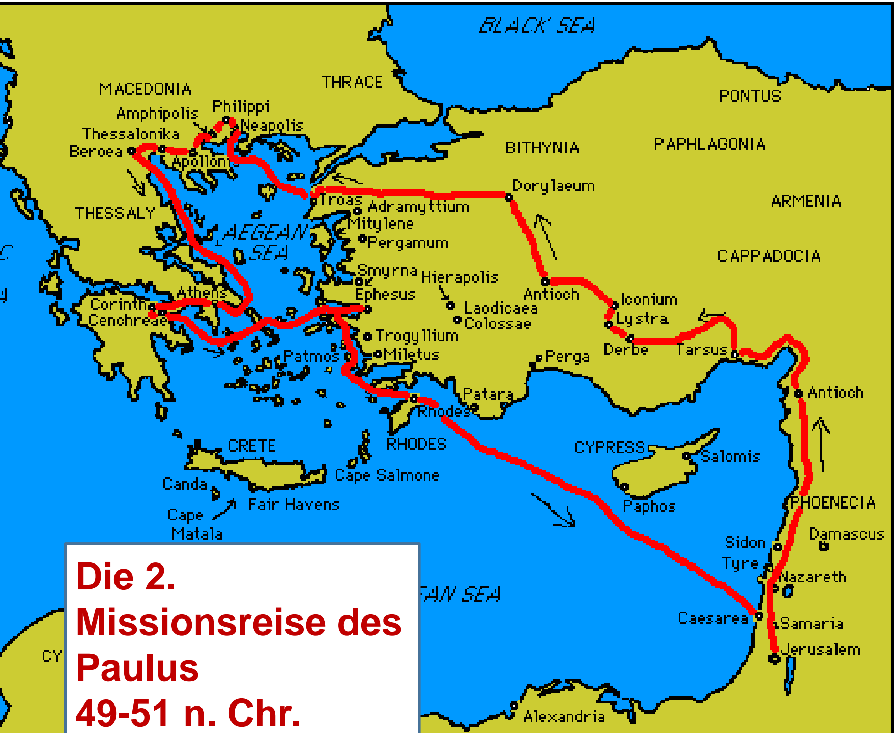
Die 2. Missionsreise des Paulus 49-51 n. Chr.