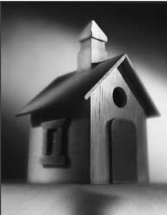
Biblische Gemeinde - Wunschraum oder Wirklichkeit ?

halten; die Aufzählung erhebt auch nicht den Anspruch auf Vollständigkeit.