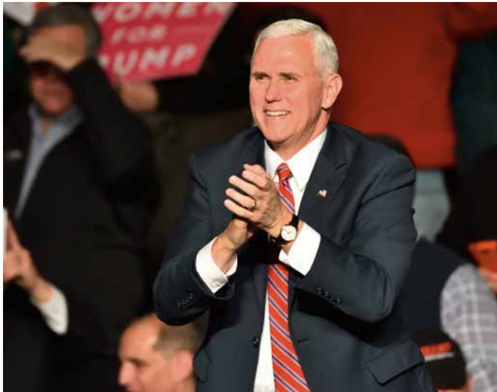
US-Vizepräsident Mike Pence