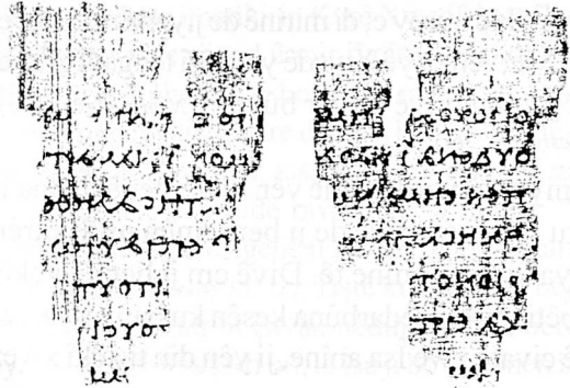
Perçeyekî Rylands ê papîrûsê yê aîdê salên 130-140 ên P.Z. ku weke nusxeyê herî Kevin a Încilê tê zanîn. Pirtûkxaneyê John Rylands a Zanîngeha Manchesterê.