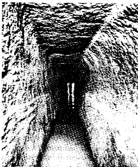
Tunelul lui Ezechia a fost săpat în stâncă de la Bazinul Siloam la Ierusalim, pentru a asigura alimentarea cu apă a cetății în cazul unui atac din partea asirienilor.

18:28-37 Adresându-se apoi direct poporului, Rabșache i-a avertizat pe evrei să nu se lase amăgiți de Ezechia, care le spunea să se încreadă în izbăvirea pe care ar aduce-o Domnul. Dacă se vor preda, le-a spus el, vor primi privilegiul de a locui, provizoriu, la Ierusalim, urmând ca după aceea, la revenirea regelui Asiriei din campania în Egipt, să fie duși de acesta în Asiria, „o țară ca a voastră“. În plus, a spus el, nici una din zeitățile tribale nu fusese în stare să izbăvească alte națiuni din mâna Asiriei. Atunci cum își închipuiau evreii că vor fi izbăviți de către Dumnezeu? Oamenii de pe metereze au tăcut, în timp ce cei trei oficiali evrei s-au înfățișat la regele Ezechia, total demoralizați.